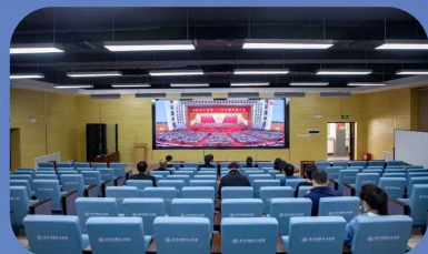
收听收看中国共产党第二十次全国代表大会开幕式

规范教学管理,先后出台了《关于进一步规范日常教学管理办法》《教学督导管理办法》等10余项教学管理制度,保障了教学管理工作规范有序开展。特别是面对常态化疫情防控要求,统筹开展线上线下教学工作,教学质量和教学秩序良好。学校被评为“2021年度陕西高等学校本科教学工作先进集体”。专业建设方面,播音与主持艺术专业获批省级一流本科专业建设点,至此我校现有国家级一流本科专业建设点1个,省级一流本科专业建设点4个,全年新增人工智能、无人驾驶航空器系统工程2个本科专业,电气工程及其自动化、飞行器制造工程2个专升本(函授)专业,室内艺术设计、空中乘务2个高职专业。实验室建设方面,全年投入近1400万元,建成了ICT智能+实验示范基地、智能制造+实验教学示范基地、时空大数据分析应用中心、财会模拟实验教学中心等10个实验室,生均教学科研仪器设备值和教学科研仪器设备新增比例均达到本科教学工作合格评估要求。招生就业方面,圆满完成全面招生计划,全校在籍学生近1.8万人,创历史新高,全面加强就业工作,开展校长书记访企拓岗促就业专项行动,加强校企合作,拓宽就业渠道,走访企业105家,签订校企合作协议22个,2022届毕业生去向落实率92.09%,就业质量稳中有升。