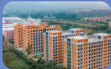
新功能区一期投入使用