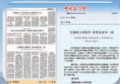
《中国教育报》聚焦我校应用型人才培养发展之路