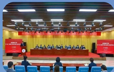
第一届一次教职工代表大会暨工会会员代表大会