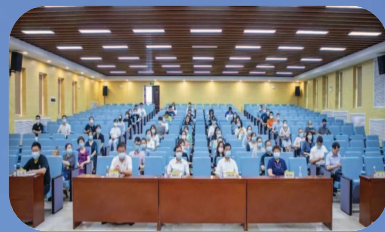
马克思主义学院成立大会